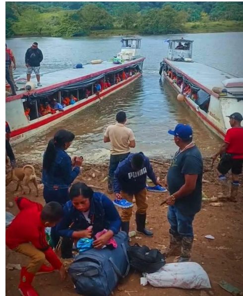
Embarcaciones de transporte público transportando mineros ilegales y descargando insumos en Las Cruces.