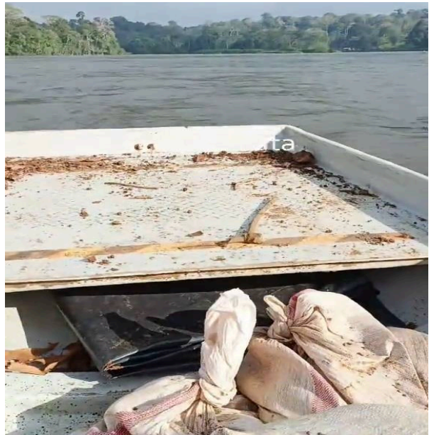
Traslado de material minero/ broza sobre el río San Juan.