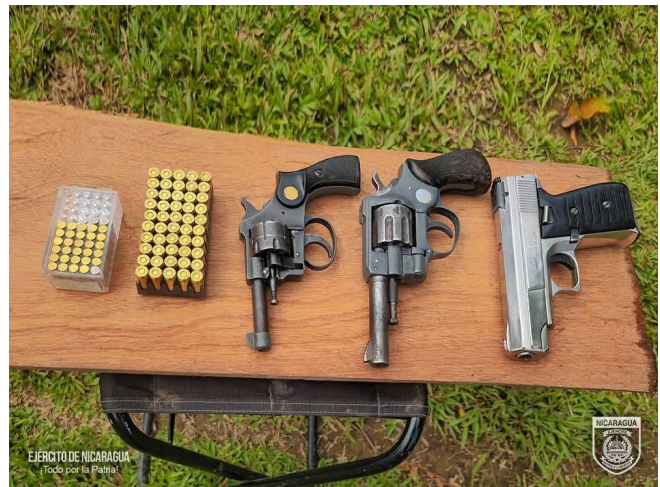
Fotografía del Ejército de Nicaragua con decomiso de armas de fuego ilegales.