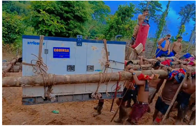
Mineros ilegales introducen generador eléctrico en el sector de Las Cruces (11 de mayo 2026).

Además se ha identificado un nuevo sitio de minería ilegal, en los cerros La Conchuda (círculo amarillo) y El Conchudo (círculo azul) del lado de Nicaragua, ubicados en el Refugio de Vida Silvestre río San Juan. Dichos sitios se encuentran a unos 3.2 kilómetros del puesto del Ejército de Nicaragua y del Ministerio de Ambiente y los Recursos Naturales (Marena), ubicado en la desembocadura del río San Carlos y a tan solo un kilómetro del cerro Conchudita (círculo rojo) de Costa Rica.