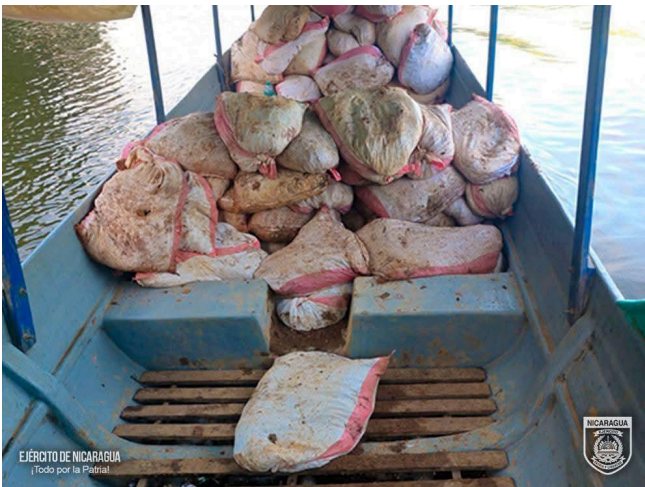
Fotografía del Ejército de Nicaragua con brozas en bote sobre el río San Juan.

Así como, el nombre de personas retenidas, entre otros. Detalles importantes para determinar las dinámicas de minería ilegal en la zona. Adicionalmente, dichos reportes permiten confirmar el tráfico ilegal de armas y municiones asociado a la actividad de minería ilegal en la zona.