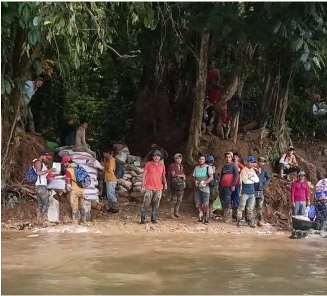
Fotografía en la zona de Conchuditas donde güiriseros nicaragüenses están sacando material y esperando transporte acuático. Marzo 2026.

La organización, también ha podido evidenciar la movilización de material minero o broza sigue siendo movido por los güiriseros o coligalleros tanto del lado de Costa Rica como del lado de Nicaragua, en ambos casos utilizan el río San Juan para el transporte acuático de estos sedimento, ya sea para procesarlo en territorio costarricense o para procesarlo en territorio nicaragüense. Tanto los reportes realizados por la Fuerza Pública de Costa Rica como los reportes locales de la organización coinciden en la continuidad de esta práctica.