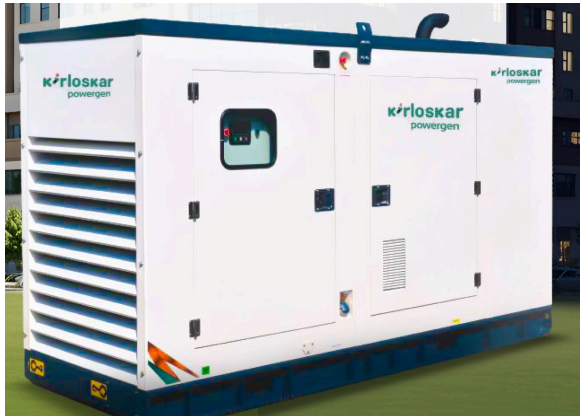
Fotografía del generador eléctrico de diésel tomada de la página web de Codinsa.